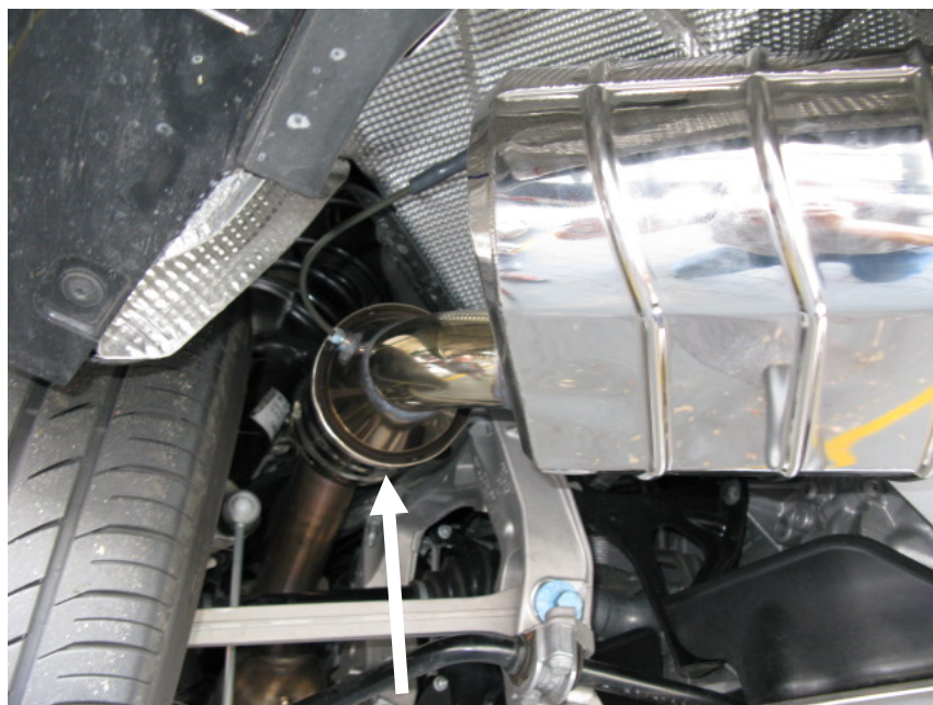
Katalysator, nicht für serienm. Euro 5 Fahrzeuge erforderlich / Catalytic converter, not for series Euro 5 vehicles necessary